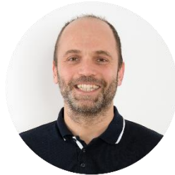
Johannes Kunschert IT-Services