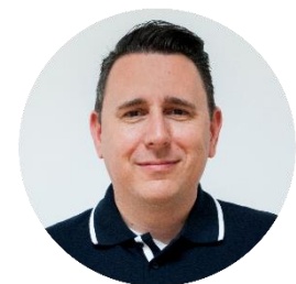
Christian Butta Vertrieb